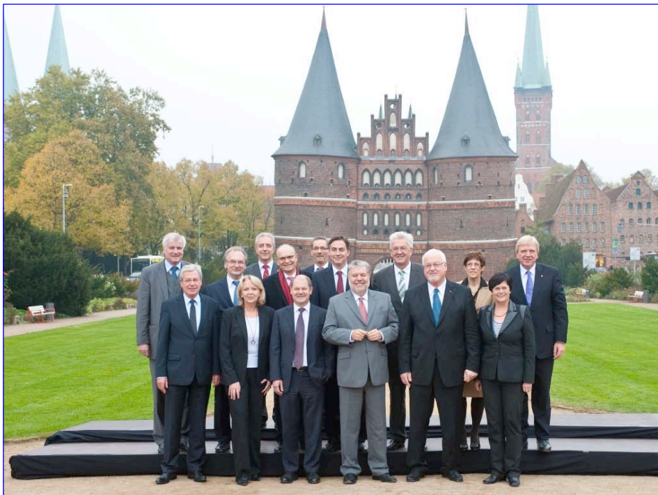
Die Regierungschefs der Länder hatten auf ihrer Konferenz am 27./28. Oktober 2011 in Lübeck als Punkt 8 auf der Tagesordnung: „Aufbau eines Zentrums für verfolgte Künste – Initiative der Else Lasker-Schüler-Gesellschaft“: Die Teilnehmer „begrüßen die Initiative, die Erinnerung an Künstler und Intellektuelle, die infolge politischer Verfolgung ins Ausland fliehen mussten, zu pflegen, deren Schaffen zu dokumentieren und zu würdigen“, heißt es im Protokoll.