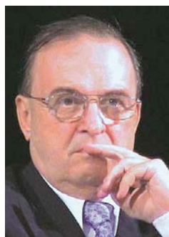
Jiří Gruša, Dichter und Brückenbauer zwischen Tschechien und Deutschland.

Journalist Georg Stefan Troller wird als Zeitzeuge in jener Schule mit Jugendlichen diskutieren, die er als 17-jähriger verlassen musste, weil er Jude war.