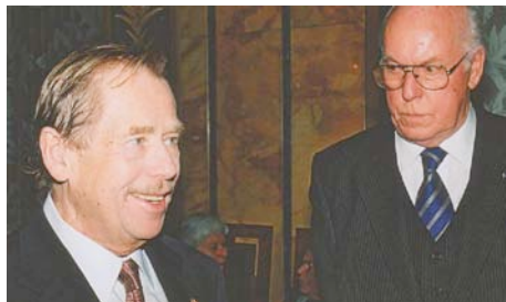
Václav Havel unterstützte als Schirmherr und Teilnehmer von ELS-Foren das Anliegen eines „Zentrums für verfolgte Künste“. Das hatte auch die Sympathie von Estlands Präsidenten Lennart Meri (r.). Beide diskutierten im Namen von Else Lasker-Schüler 2004 im Historischen Rathaus Prag.

Meinungsfreiheit unserer Nation. Die Thematik bleibt uns erhalten, so lange es machtgerige Politiker gibt. Was für das „Zentrum gegen Vertreibung“ billig ist, muss auch das „Zentrum für verfolgte Künste“ – eine interdisziplinäre Einrichtung, die es so bislang ausser in Solingen nicht gibt – recht sein. Bei Václav Havel heisst es: „Hoffnung war nicht die Überzeugung, dass etwas gut ausgeht, sondern die Gewissheit, dass etwas Sinn hat, egal wie es ausgeht.“